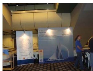
Foto einblenden (auf Stand verweisen, der im Foyer aufgebaut ist)